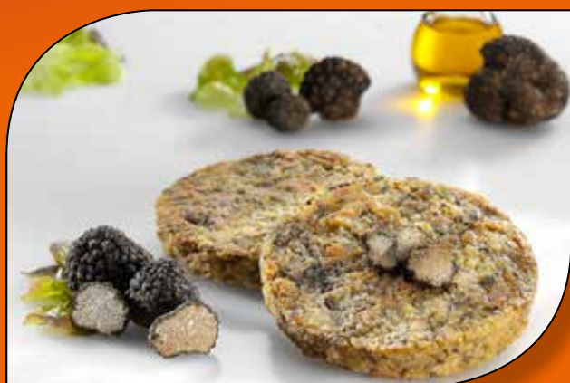
BURGER DI FUNGHI CON TARTUFO