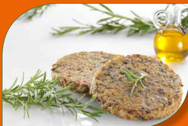
BURGER DI FUNGHI CON ROSMARINO