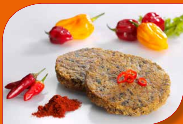
BURGER DI FUNGHI CON PAPRIKA