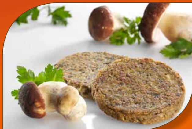
BURGER DI FUNGHI CON PORCINI