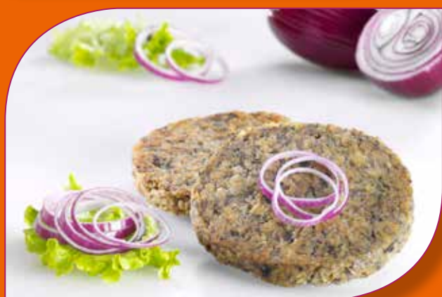
BURGER DI FUNGHI CON CIPOLLA