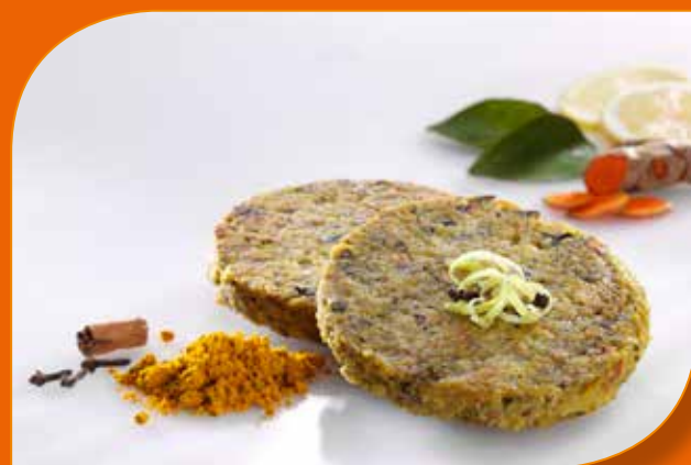
BURGER DI FUNGHI CON CURRY